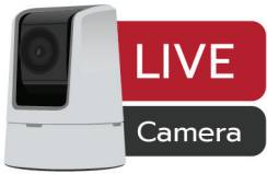
Live stream cam