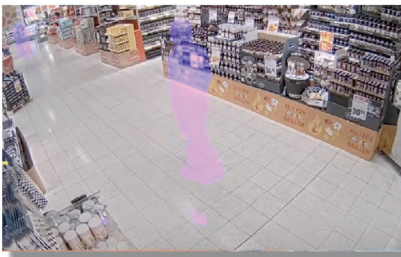
การมาสก์แบบไดนามิกตามการเคลื่อนไหว (Motion-based dynamic masking)

เนื่องด้วยกฎหมาย PDPA ในปัจจุบันทำให้การใช้ข้อมูลทางด้านภาพที่จะมาเปิดเผยจึง มีความสำคัญ แต่เหตุการณ์ที่เกิดขึ้นก็มีความจำเป็นที่ต้องนำมาใช้เพื่อพิสูจน์และตรวจตรา ความปลอดภัย และ ความถูกต้อง ของข้อมูลเหตุการณ์ ดังนั้น Privacy Shield เป็น คุณสมบัติที่มาตอบโจทย์ในการนี้ Privacy Shield เป็นการตรวจสอบกิจกรรม เหตุการณ์ ต่าง ๆ จากระยะไกล ในขณะที่เดียวกันก็สามารถปกป้องความเป็นส่วนตัวของบุคคลในภาพ แอปพลิเคชันอเนกประสงค์นี้ ช่วยให้กล้องที่ใช้งานร่วมกัน สามารถปกปิดวัตถุเคลื่อนไหว, มนุษย์ , ใบหน้า หรือพื้นหลังแบบไดนามิกแบบเรียลไทม์ในวิดีโอสดหรือวิดีโอที่บันทึกไว้ได้