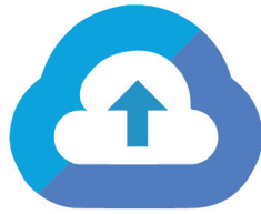
Cloud Storage Solution