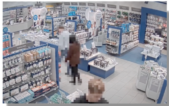
การมาสก์แบบไดนามิกที่ใช้ AI (AI-based dynamic masking)