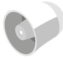
IP Public Address